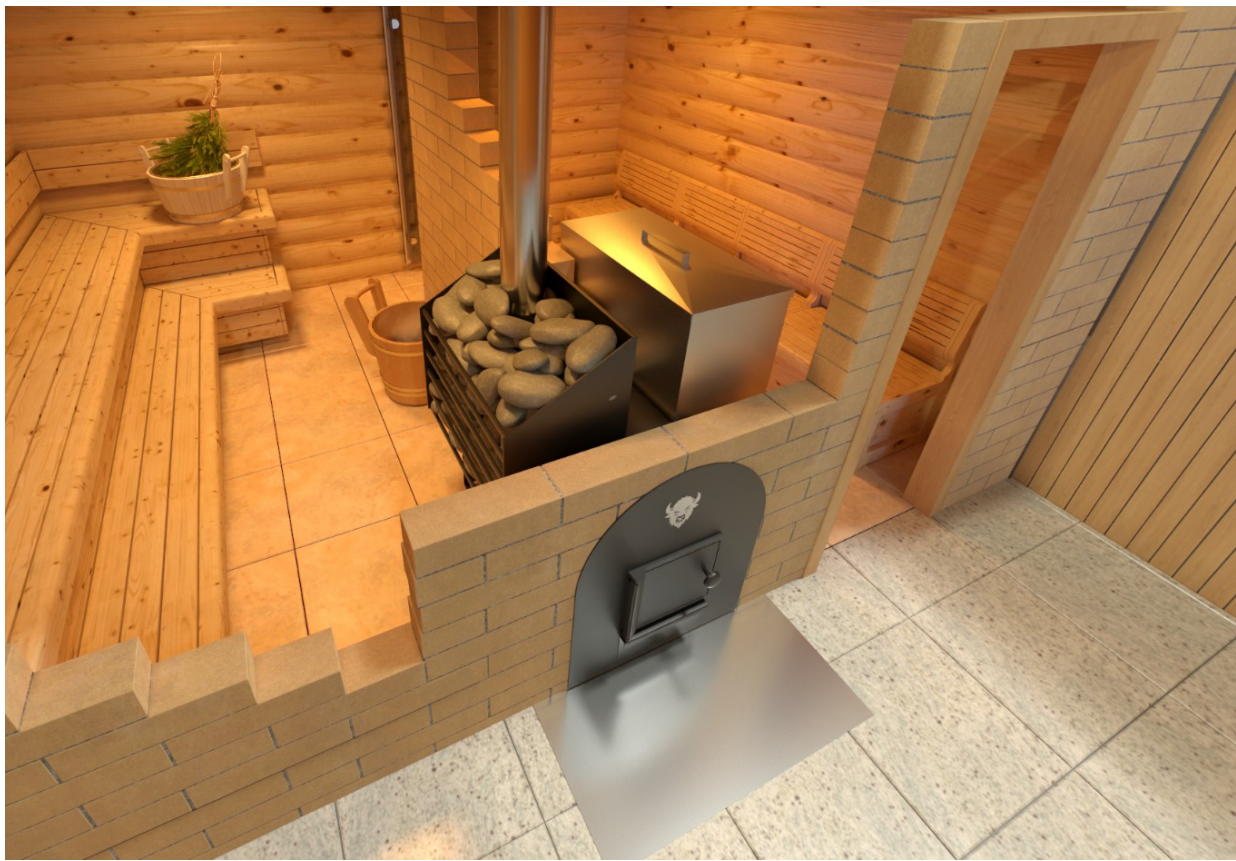
Рисунок 2. Установка банной печи «Бизон Квадра».