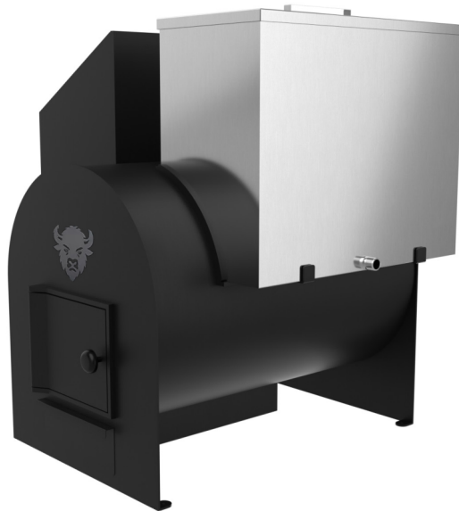
Рисунок 1. Размеры банной печи «Бизон Квадра».